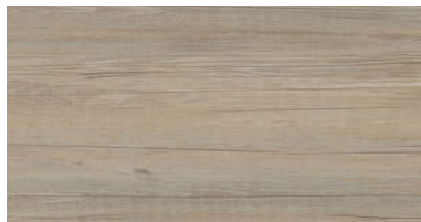
LLP 92 Country Oak