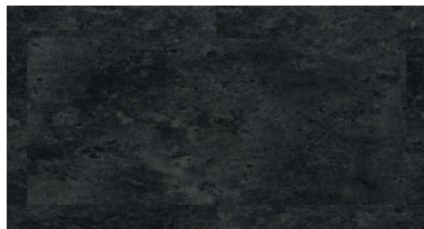
LLT 203 Madison Arizona