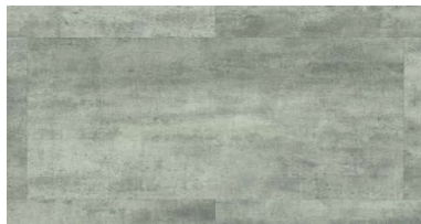
LLT 201 Colorado