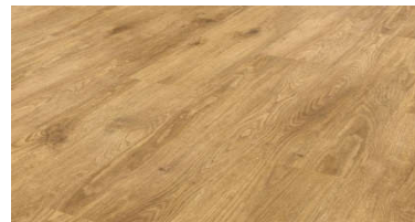
LLP 108 Providence