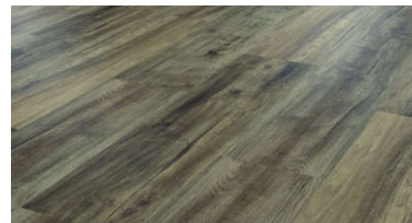
LLP 112 Hartford